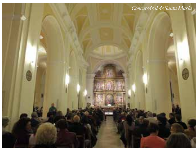
Concatedral de Santa María