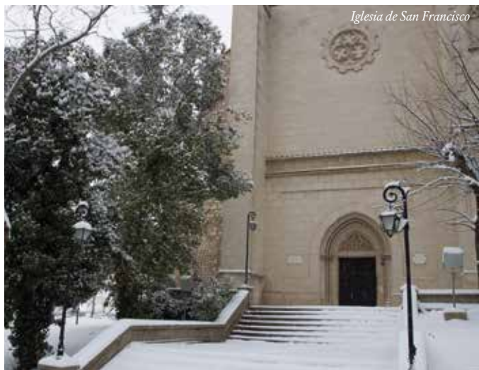
Iglesia de San Francisco