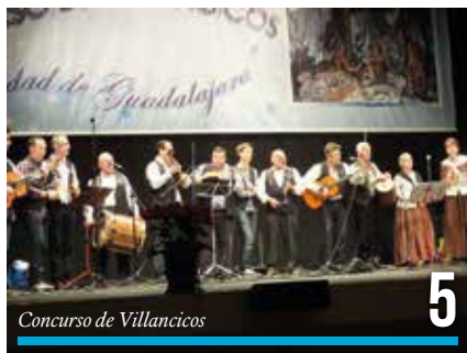
Concurso de Villancicos