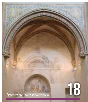
Iglesia de San Francisco